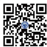
제8회 민송백일장 접수